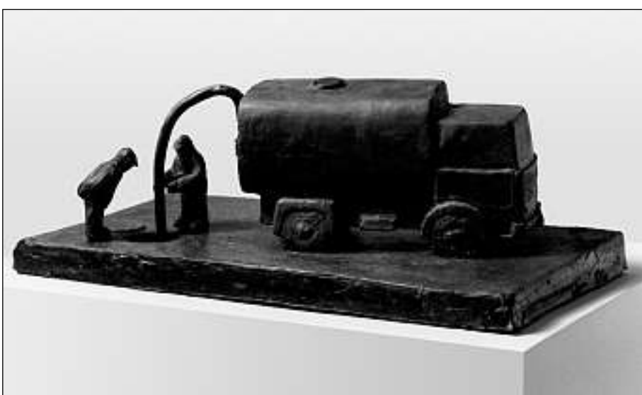
Lavurers da chanal, culada da gomma, 1987.

Dapli sut: www.wikipedia.ch u www.kunsthau.ch