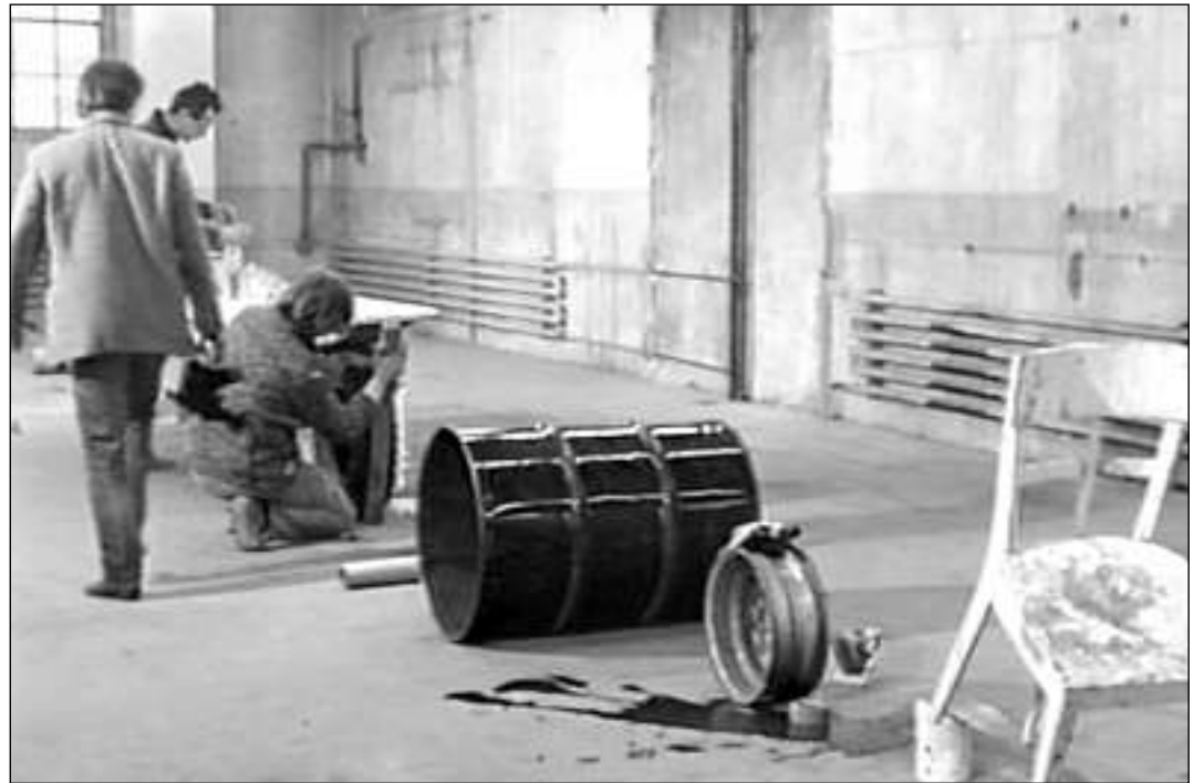
En il lavuratori durant las lavurs per «Der Lauf der Dinge» – in film davart ina reacziun da chadaina.