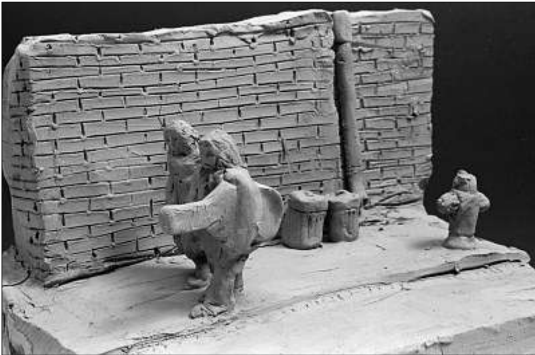
Mick Jagger e Brian Jones tut cuntents sin viadi a chasa suenter ch'els han cumponi «I Can't Get No Satisfaction», arschiglia, 1981.